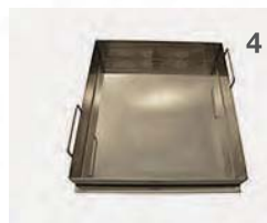
Edelstahlwanne geeignet für Grillgut in Flüssigkeit