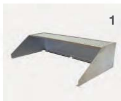
Windschutz/ Spritzschutz mit Ablage RGS