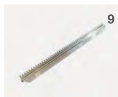
Fischgrillaufsatz Flammenabdeckung notwendig