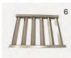
Flammenabdeckung für Rundstabrost