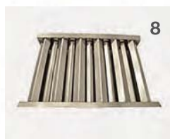
Flammenabdeckung für Lavarost (V-Rost)