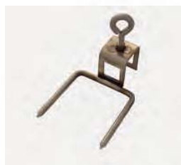
Außenklammer für Spieß