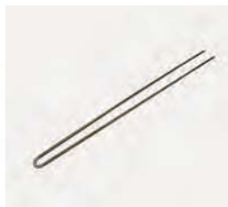
Elektroheizkörper U-förmig 3,0 kW