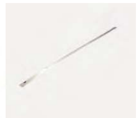
Halteschiene für Brenner 3