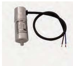
Kondensator 2/4/8 µF