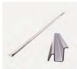
Führungsschiene (schmal) für Brenner 2